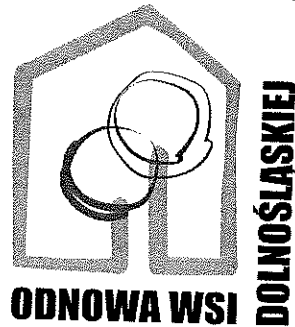
Rys.4: Zestawienie znaków graficznych

Gmina Ścinawa Rynek 17, 59-330 Ścinawa tel. 76 84 12 600, faks 76 84 12 601