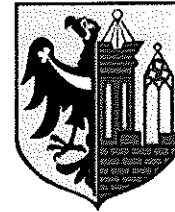
Rys.3: Zestawienie znaków graficznych