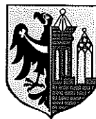
Rys. 2: Zestawienie znaków graficzny