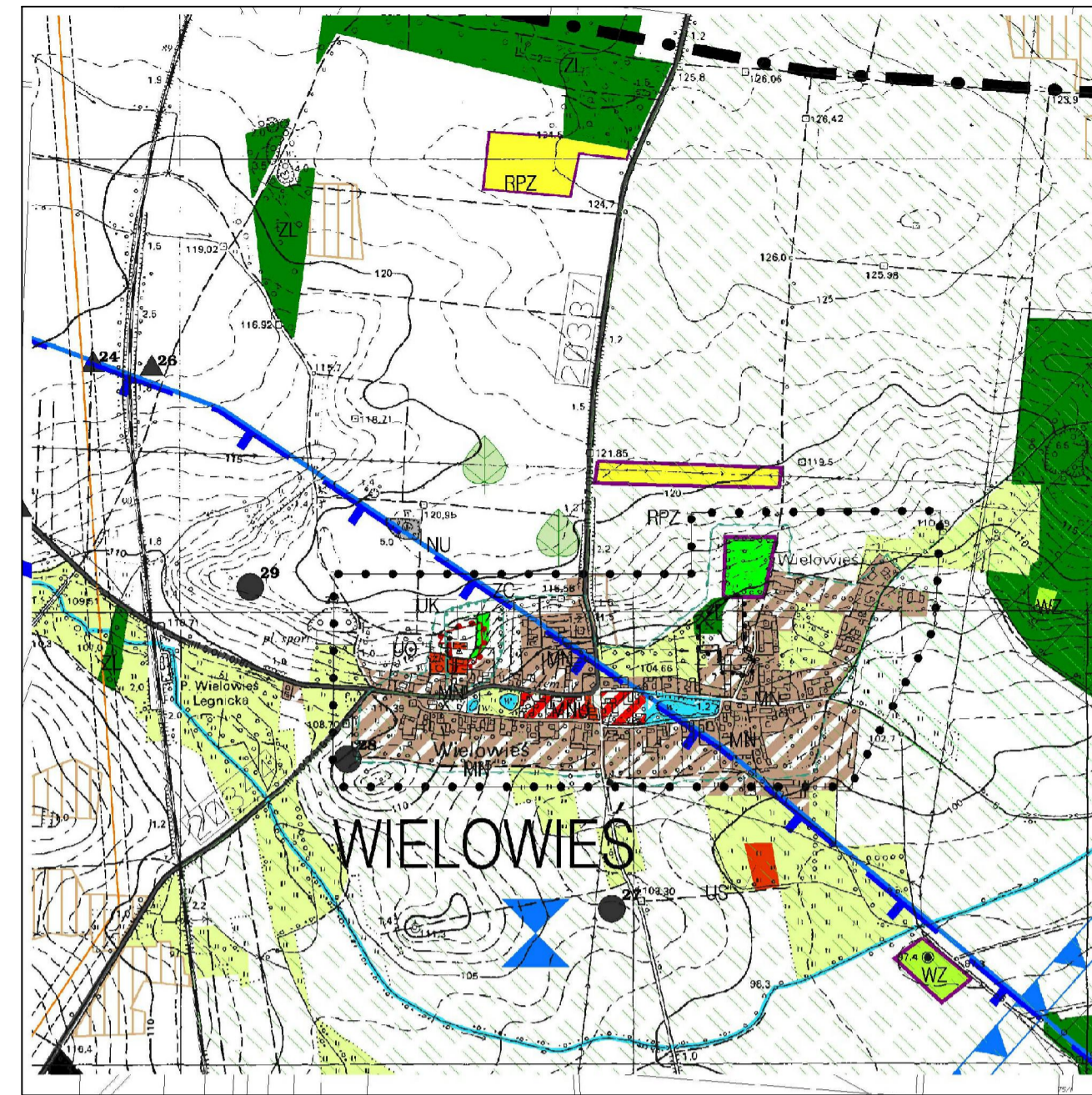
Wrys z studium uwarunkowań i kierunków zagospodarowania przestrzennego gminy Ścinawa

SKALA 1:2000 rysunek przeskalowany do celu sprawdzenia zgodności do skali 1:4000