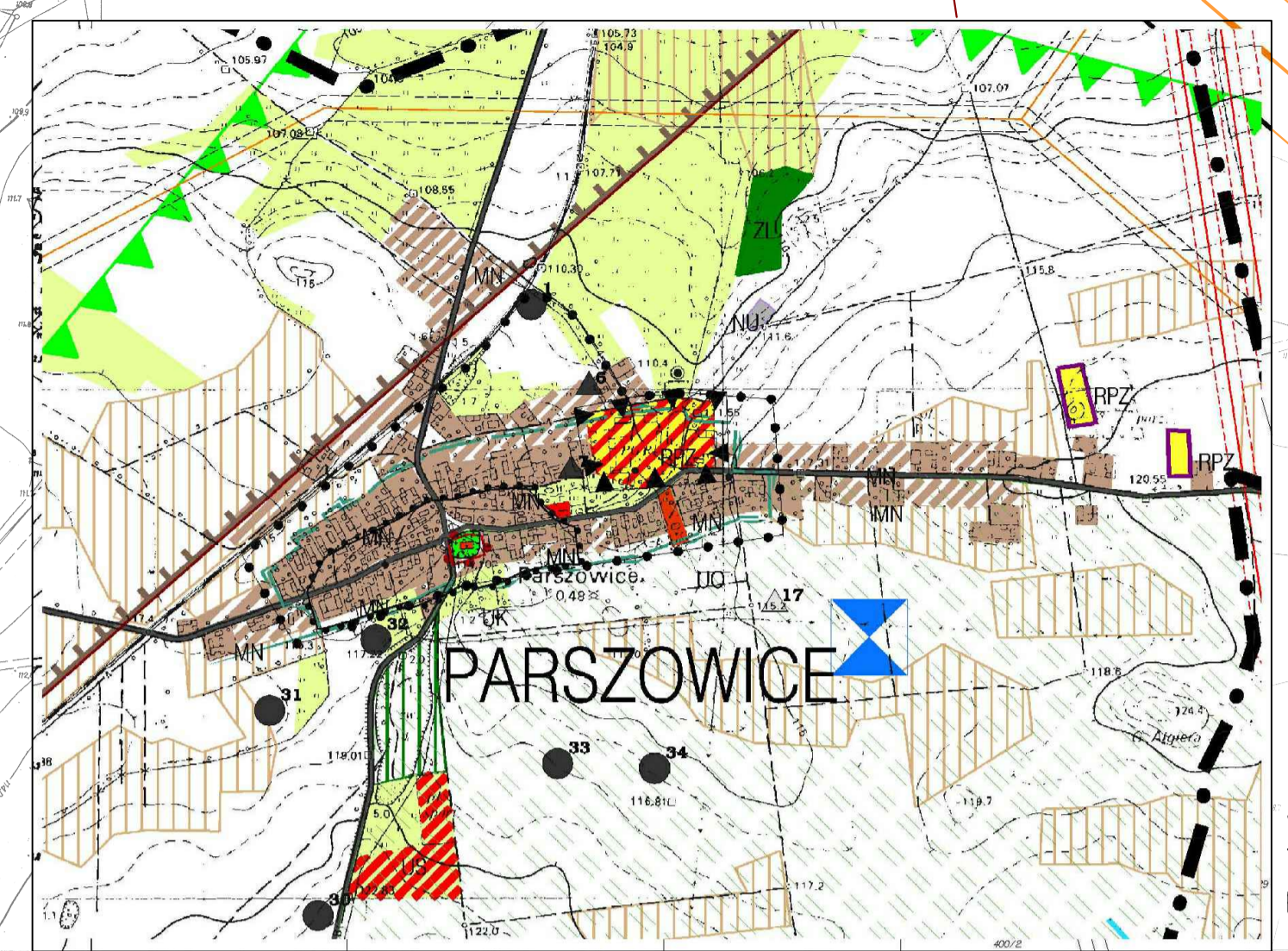
Wrys ze studium uwarunkowań i kierunków zagospodarowania przestrzennego gminy Ścinawa

SKALA 1:2000 rysunek przeskalowany do celu sprawdzenia zgodności do skali 1:4000