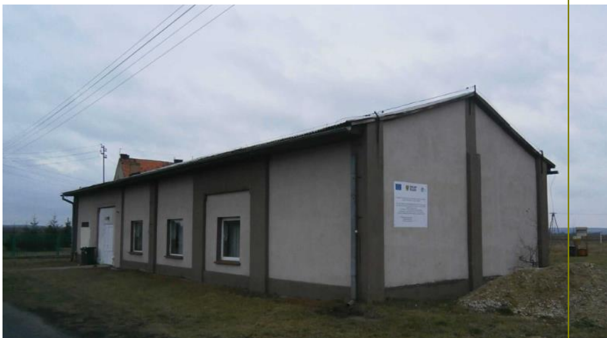
Rysunek Świetlica w Lasowicach