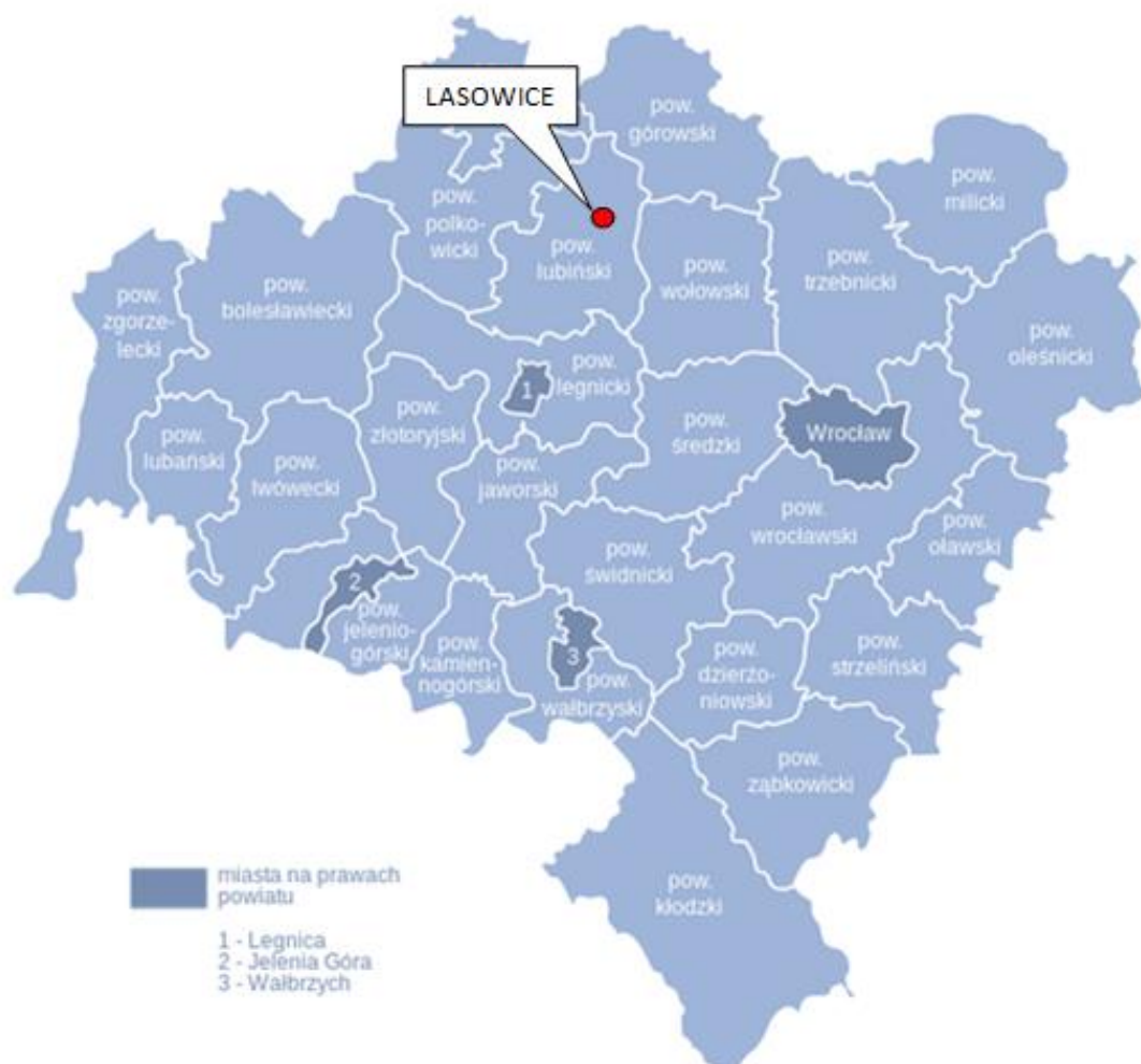
Mapa Lokalizacja miejscowości Lasowice na tle województwa dolnośląskiego

umożliwiają dobre połączenia komunikacyjne z Wrocławiem, Głogowem i Lubinem.